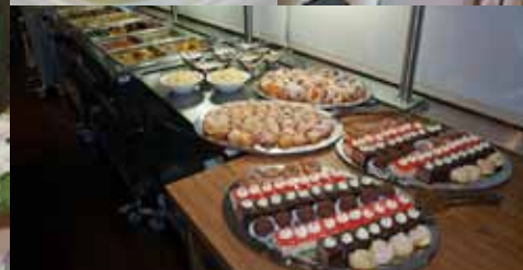
SVATBA LENKA A KAMIL MONÍNEC, ŘÍJEN 2012